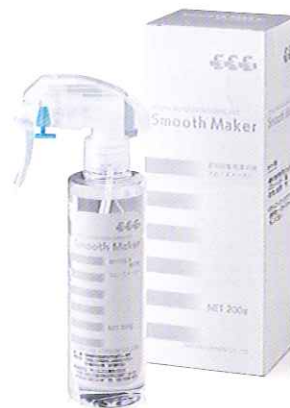
スムーズメーカー 歯科印象用滑沢剤 200gボトル